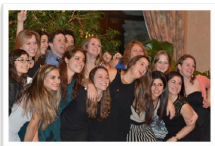
Membres du comité organisateur

Le jeudi, les étudiants ont participé à diverses activités touristiques, y compris une visite d'installations avec des animaux en captivité (Biodôme, Zoo de Granby, Aquarium de Québec et Chouette à Voir). Certains ont plutôt opté pour une activité physique et ont fait du ski à Bromont ou encore du patinage ou du toboggan sur le Mont-Royal. La journée s'est terminée par une soirée de karaoké où de nombreux talents (ou l'absence de talents) ont été découverts!